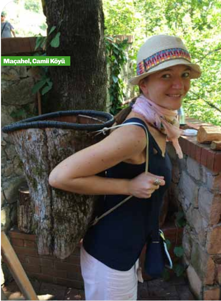
Maçahel, Cami Köyü

sahip, bir o kadar da modern Batum'a vizesiz girilebiliyor. O nedenle de oralara kadar gitmişken mutlaka uğranması gereken bir Gürcistan kenti.