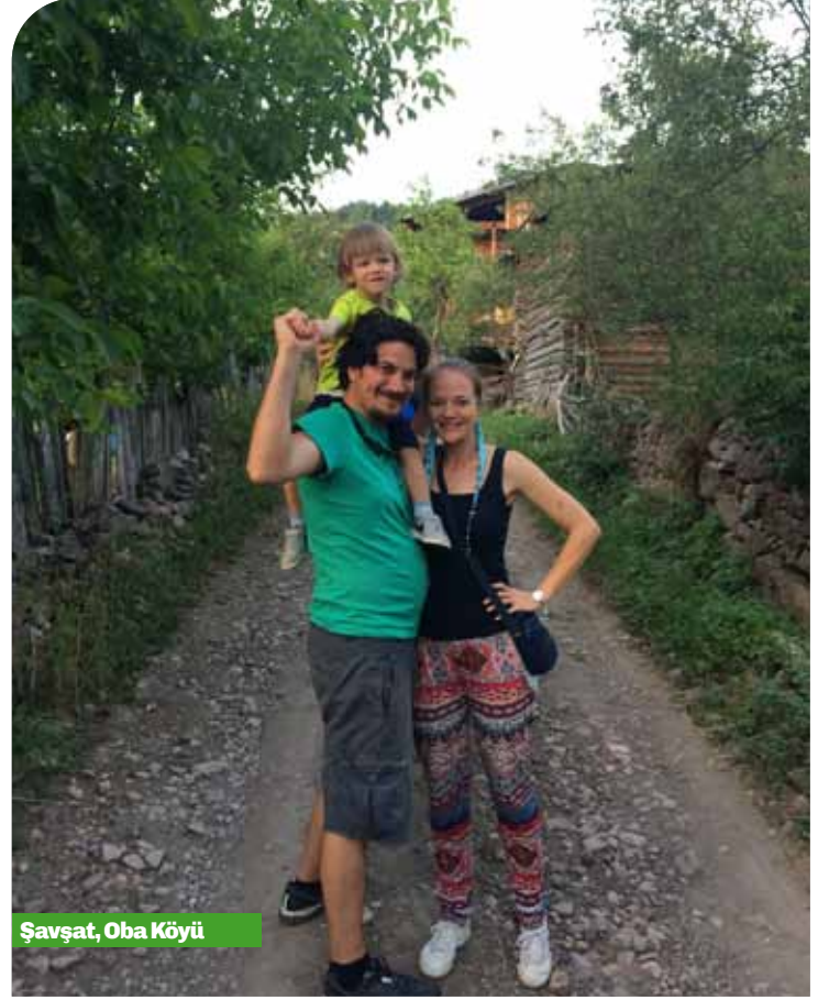
Şavşat, Oba Köyü

Haldizen deresinin önünü kapatmasıyla oluşmuş göl, çevresinde artan tesislere ve açılan yollara meydan okur güzellikteydi hala.